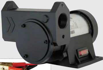
IRON-50 (12 o 24 VCC)